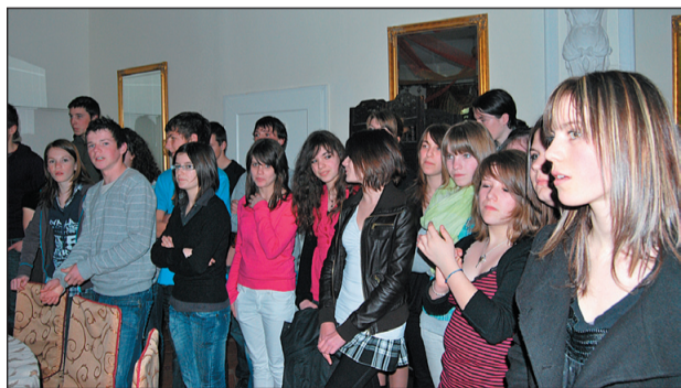
Spotkanie integracyjne młodzieży francuskiej i polskiej

Blisko 40-osobowa grupa młodzieży z Plénée-Jugon gościła po raz szósty w Wałbrzysku. Ta wizyta to jeden z elementów ogólcioeuropejskiego projektu. Jeszcze we wrześniu ponad 20 wałbrzyskich uczniów odwiedzi Francję.